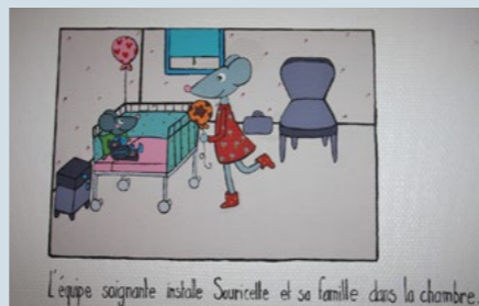
L'équipe soignante installe Souricette et sa famille dans la chambre.